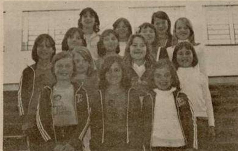
Na foto o grupo de garotinhas concorrentes ao título de rainha da Escola Estadual João Triches. Um grupo muito bem identificado cujas componentes estão adorando esta badaladação estudantil.

A Direção da Escola Estadual de 1º Grau JOÃO TRICHES, através de nossa coluna, convida aos simpatizantes da escola para o chá beneficente, o qual se realizará na data de 18 do corrente, no Salão de Festas da Igreja dos Capuchinhos.